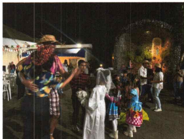
Participação Social com as famílias