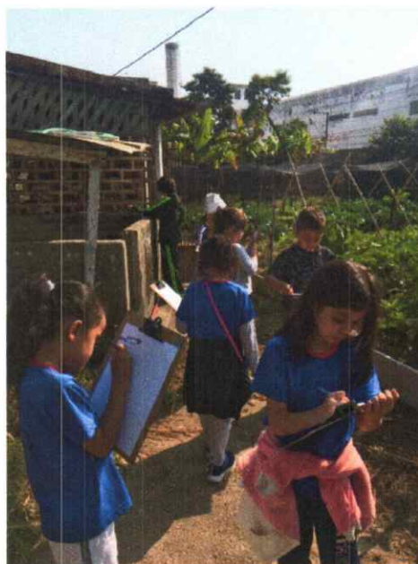
Oficina de Participação Social