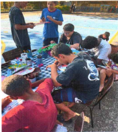
20/07/2024 - Oficina de Educomunicação