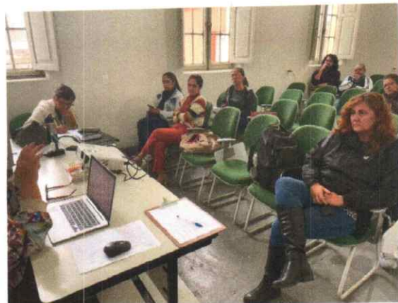
Reunião do CMDCA 06/06/2024