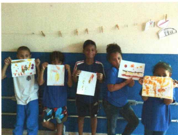
Oficina de Participação Social

Observações: Participação dos usuários em anexo