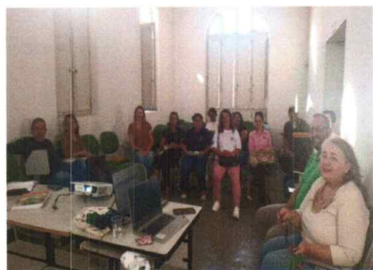
Reunião do CMDCA 20/06/2024