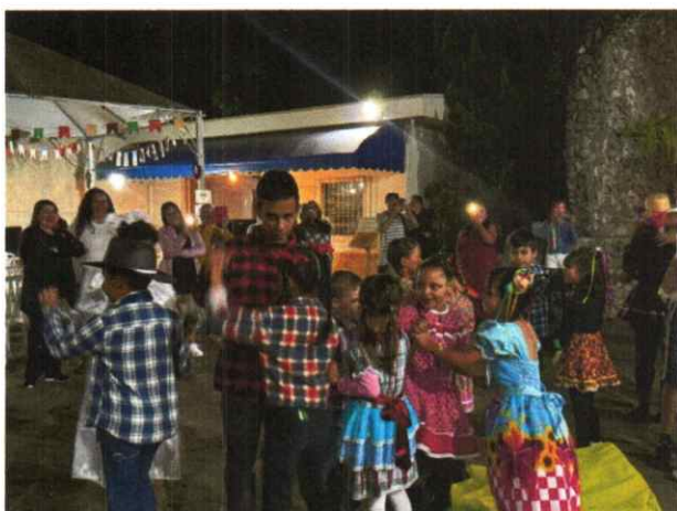
Participação Social com as famílias