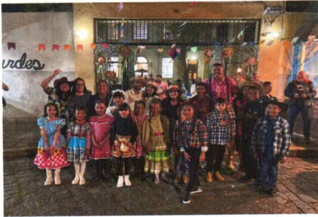
22/07/2024 - Festa Junina