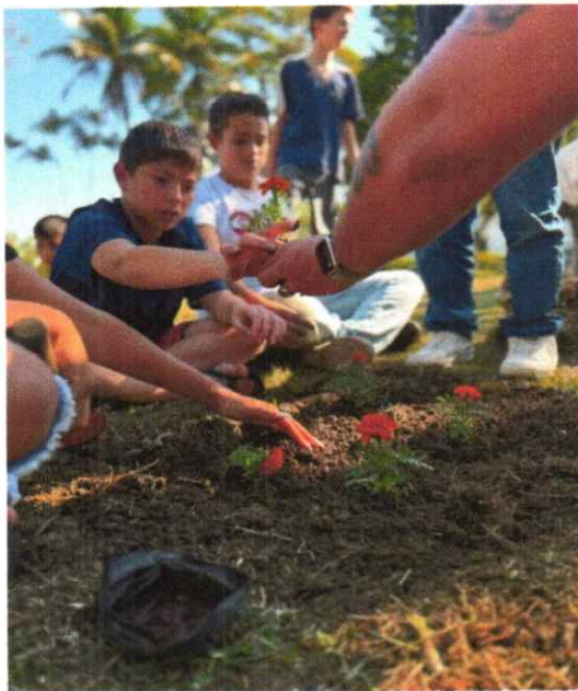
11/07/2024 - Oficina de Educação Socioambiental